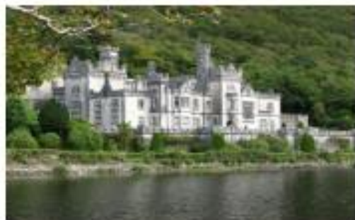
Ashtown Castle bâti vers 1430